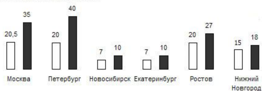
Зарплата водителя-экспедитора в 2007, тыс. руб.