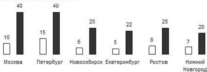
Зарплата офисного водителя (без функций экспедирования грузов) в 2007, тыс. руб.